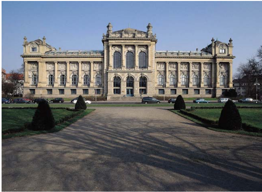
Abbildung 3: Das Niedersächsische Landesmuseum Hannover.