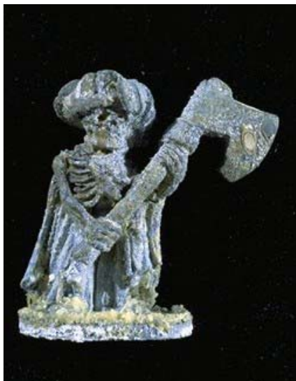
Abbildung 1: Durch Essigsäure angegriffener Bleisoldat (Photo: Jean Tétreault).

Die Verunreinigung der Innenraumlufte mit Fremdstoffen kann verschiedene Ursachen haben. Zum einen werden Substanzen wie z.B. Ozon, Stickoxide und Schwefeldioxid über die Außenluft eingetragen. Als wesentliche Quelle von Luftverunreinigungen im Innenraum selbst sind jedoch Bau- und Inneneinrichtungsmaterialien anzusehen. Das Emissionsverhalten derartiger Materialien ist stark von ihrem Alter abhängig und wird von den klimatischen Parametern beeinflusst, die unter normalen Arbeits- und Wohnbedingungen ständig wechseln. Zur Akkumulation trägt neben den heute meist sehr luftdichten Räumen (als Konsequenz der Wärmeschutzverordnung von 1982) ein schlechtes Lüftungsverhalten (Salthammer, 1994) bei.